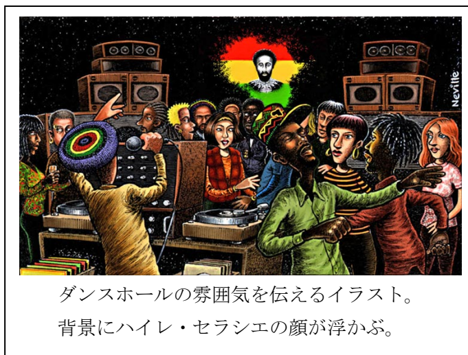
ダンスホールの雰囲気を伝えるイラスト。 背景にハイレ・セラシエの顔が浮かぶ。

For Jamaica's ghetto youth (the black lower-class masses), from among whom come its most creative artists and avid fans, dancehall is their favorite recreational form. Yet dancehall is not merely a sphere of passive consumerism. It is a field of active cultural production , a means by which black lower-class youth articulate and project a distinct identity in local, national, and global context; through dancehall, ghetto youth also attempt to deal with the endemic problems of poverty, racism, and violence.